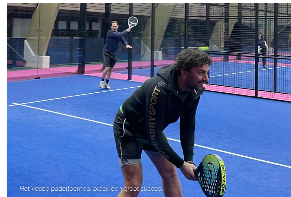
Het Vespo padeltoernooi bleek een groot succes.

Ook vinden we het binnen Vespo belangrijk dat medewerkers zich veilig voelen op werk én daarbuiten. Daarom hebben we dit jaar een vertrouwenspersoon aangesteld, geregistreerd via Hobeon en lid van de Landelijke Vereniging van Vertrouwenspersonen.